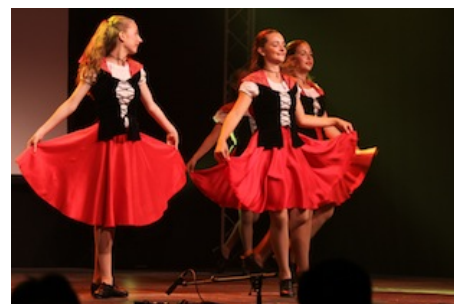
La Baie en Joie